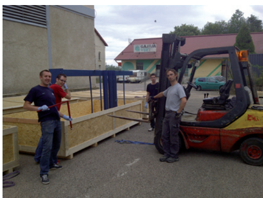
↑ Mise en caisse pour départ UE

fin d'année 2011 ... avant de poursuivre les installations dans l'UE en 2012. voire dans le monde si notre offre «monde» est retenue. Croisons les doigts.