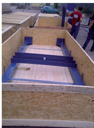
Structure «H» squelette des totems 4m de sécurité ARKEMA