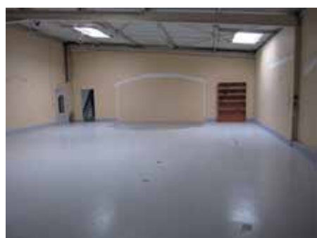
Ca ! c'était avant !

Les travaux à peine terminés et c'est déjà l'opération déménagement / emménagement qui a pris le relais avec un emménagement définitif prévu pour le 31 décembre 2012 ... Ensuite nos collaborateurs auront largement gagné le droit d'aller fêter cette fin d'année 2012 en pensant à 2013 placée sous le signe du développement durable de la société.