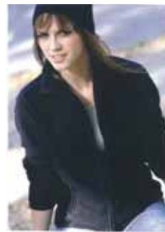
K907 MAUREEN VESTE POLOIRE FEMME Bretelles 100 % polyester. Fermeture à glissière. Cols en tissu. 2 poches zippées. Biais de finitions en polyester et coton. 100 % polyester. 100 % polyester. 100 % polyester.

Le CE TRADEVIA et la Direction vous offre un cadeau !