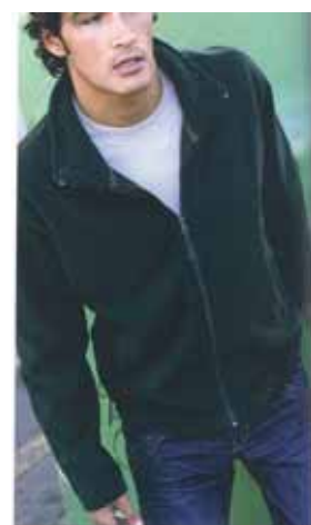
NEW K911 FALCO VESTE MICROPOLAIRE ZIPPEE 100% polyester micropolaire. 2 poches zippées sur le devant. Fermeture zippée.

Si toutefois lors de la distribution vous n'avez pas reçu votre cadeau et que vous comptabilisez 6 mois d'ancienneté en 2008, alors n'hésitez pas à appeler nos services administratifs pour nous en aviser. Nous ferons alors le nécessaire rapidement pour vous faire parvenir votre cadeau.