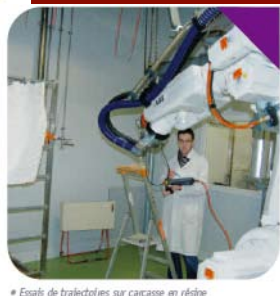
* Essais de trajectoires sur carcasse en réaline

frein au développement de cette technologie. La qualité, sans cesse recherchée dans notre filière, saura également ralentir les velléités de nos développeurs.