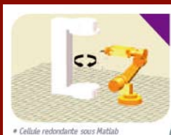
* Cellule redondante sous Matlab

La guerre des muscles a commencé ... Sans prendre cette menace à la légère, nous savons que la morphologie des animaux, identiques à celle de l'homme dans sa spécificité et surtout sa diversité sera un