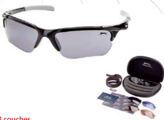
2ème PRIX : Lunettes de soleil SPORT SLAZENGER conforme norme EN1836