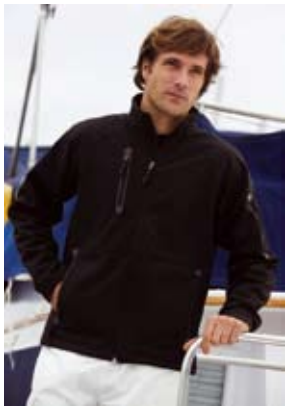
1er PRIX PREMIUM : VESTE PEN DUICK Soft Shell 3 couches modèle PLYMOUTH (Homme ou Femme)

> une partie «BOITE A IDEES / SUGGESTIONS» qui vous permettra de proposer des solutions ou des actions à mettre en place dans le cadre de nos différentes politiques (sociale, sécurité et santé au travail ...). Nous récompenserons les 3 meilleures idées déposées dans notre boîte à idée. Voici les lots PREMIUM que recevront les lauréats (l'étude et l'analyse des idées déposées seront en fonction de leurs intitulés présentées en réunion CE/DP et/ou CHS-CT. N'hésitez surtout pas ... Il n'y a pas de mauvaises idées et nul besoin de nous rédiger un roman, laissez libre court à votre imagination et ne vous fixez pas de limite. Vous pouvez participer à améliorer vos conditions de travail et/ou votre environnement de travail ainsi que celui de vos collègues...Nous vous attendons nombreux sur : www.forum.groupe-peace.com