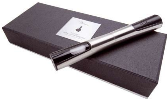
3ème PRIX : Thermomètre à vin à infrarouge PAUL BOCUSE