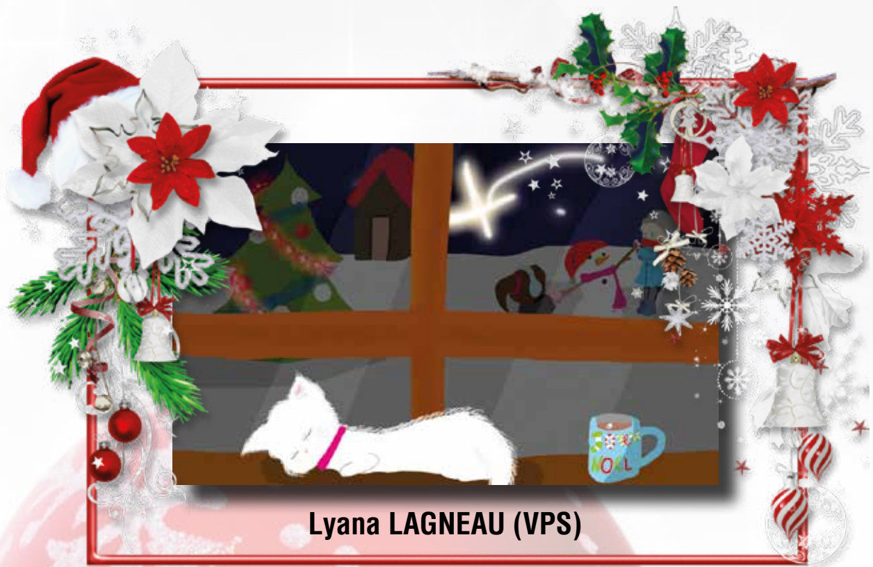
Lyana LAGNEAU (VPS)

Félicitations Lyana, et merci à tous pour votre participation !